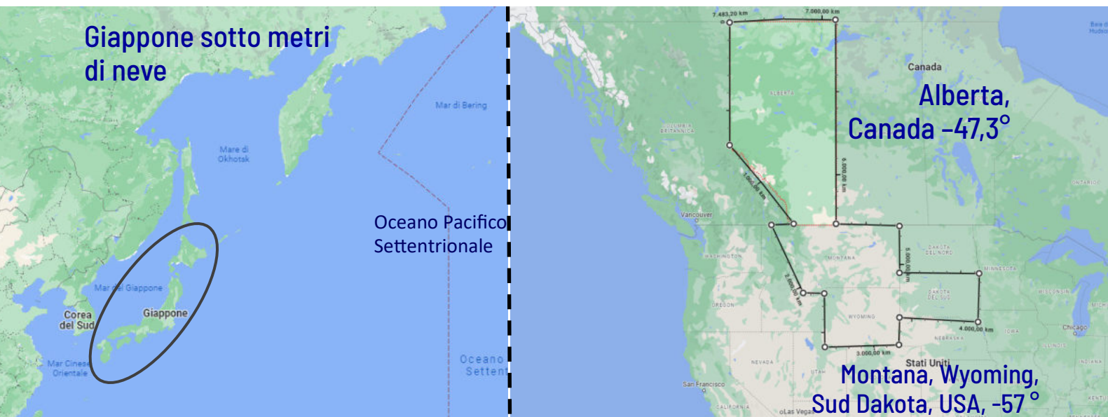
La cartina dell'Oceano Pacifico Settentrionale con le aree investite dal gelo: Canada, USA e Giappone

Scrive Sarkar: "I ghiacci del Polo si scioglieranno e il livello degli oceani si alzerà. Ciò avrà un impatto sulla dimensione delle onde marine in tutto il globo. L'Oceano Pacifico diverrà più freddo e poi gelerà. Molti dei porti esistenti chiuderanno. I modelli stagionali cambieranno. Le piogge e le variazioni climatiche avranno un grosso impatto sulla flora e sulla fauna". ( Vai al sito web )