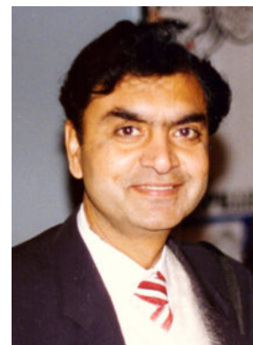
Prof. Ravi Batra, economista

Così ogni cittadino avrà il reddito minimo + l'incentivo adeguato alla propria categoria di lavoro. Ciò non toglie che una persona possa, con l'impegno ottenere incentivi maggiori.