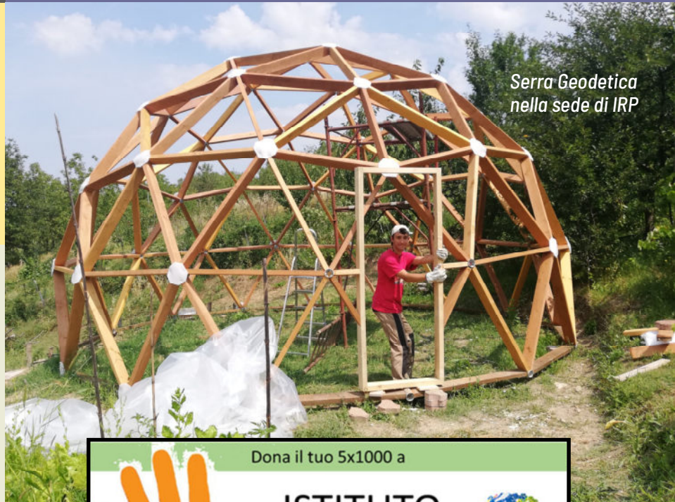
Serra Geodetica nella sede di IRP