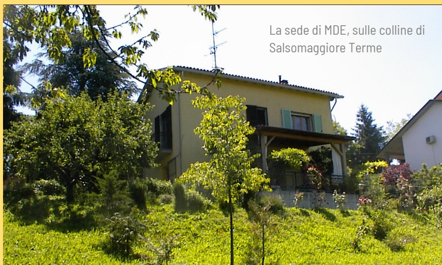
La sede di MDE, sulle colline di Salsomaggiore Terme

Inviare una mail a mdecontatti@gmail.com con i tuoi dati.